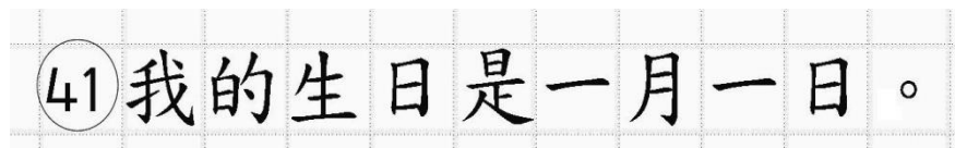
Рис.14. Образец написания иероглифических знаков

иероглифический знак и каждый знак препинания следует писать внутри отдельной клетки области ответов бланка ответов № 2 (дополнительного бланка ответов № 2) (рис. 14).